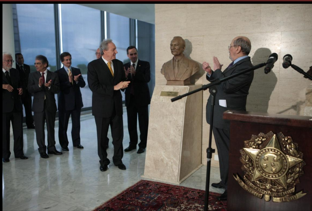
Foto da direita para a esquerda: Ministro Sepúlveda Pertence, Ministro Lewandowski, Ministro Barroso, Ministro Cesar Peluso, Ministro Carlos Ayres Britto.