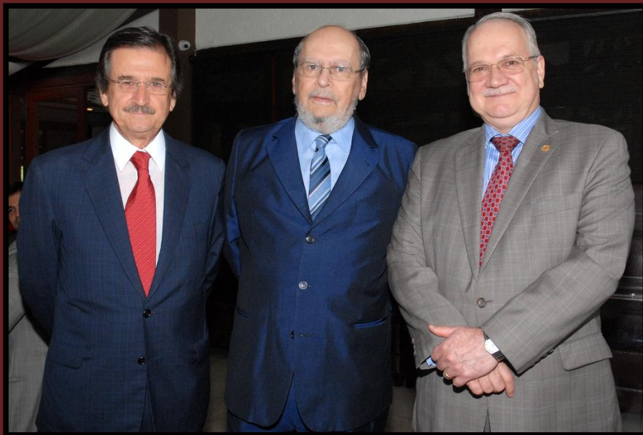
Da direita para a esquerda: Ministros Cezar Peluso, Sepúlveda Pertence, e Edson Fachin